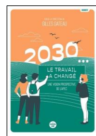
2030... Le travail a changé Gilles Gateau Le Cherche Midi 24/10/2024