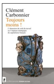
Toujours moins ! Clément Carbonnier La Découverte 16/10/2025