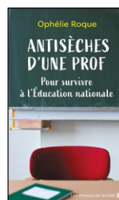
Antiséches d'une prof Ophélie Roque, Presses de la Cité 27/03/2025