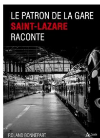
Le patron de la gare Saint-Lazare raconte Roland Bonnepart Atlante 19/06/2025