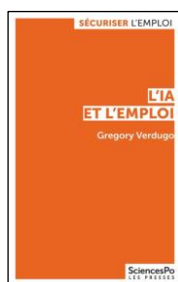
L'IA et l'emploi Grégory Verdugo SciencesPo-Les Presses 03/10/2025